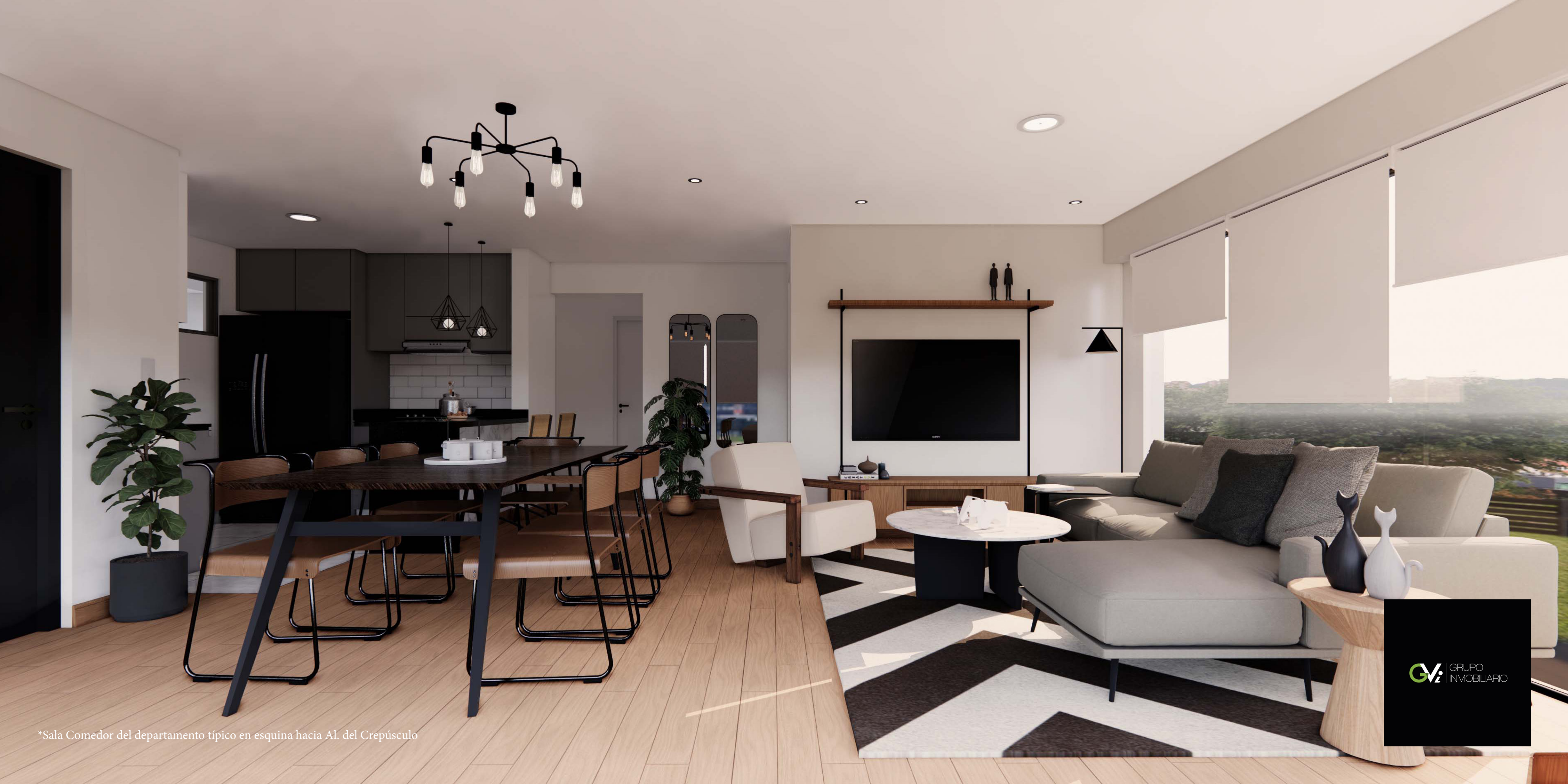
*Sala Comedor del departamento típico en esquina hacia Al. del Crepúsculo