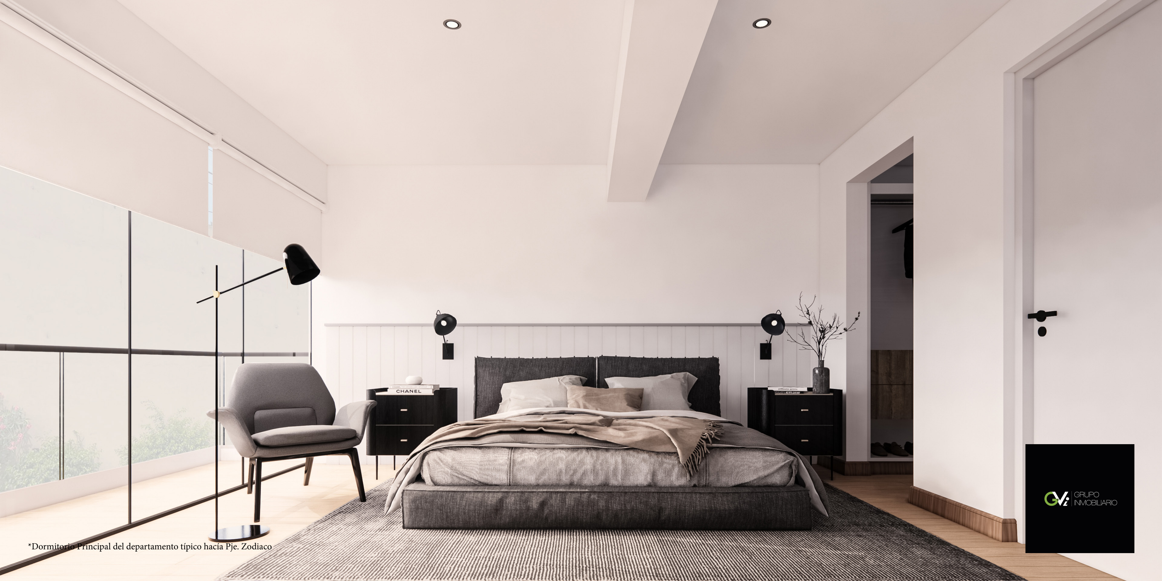
*Dormitorio Principal del departamento típico hacia Pje. Zodiaco