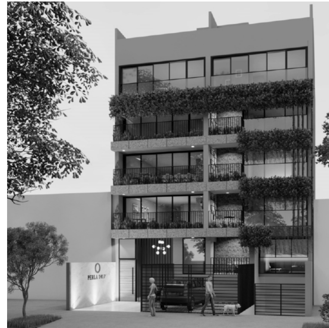
Av. Ayacucho 1417