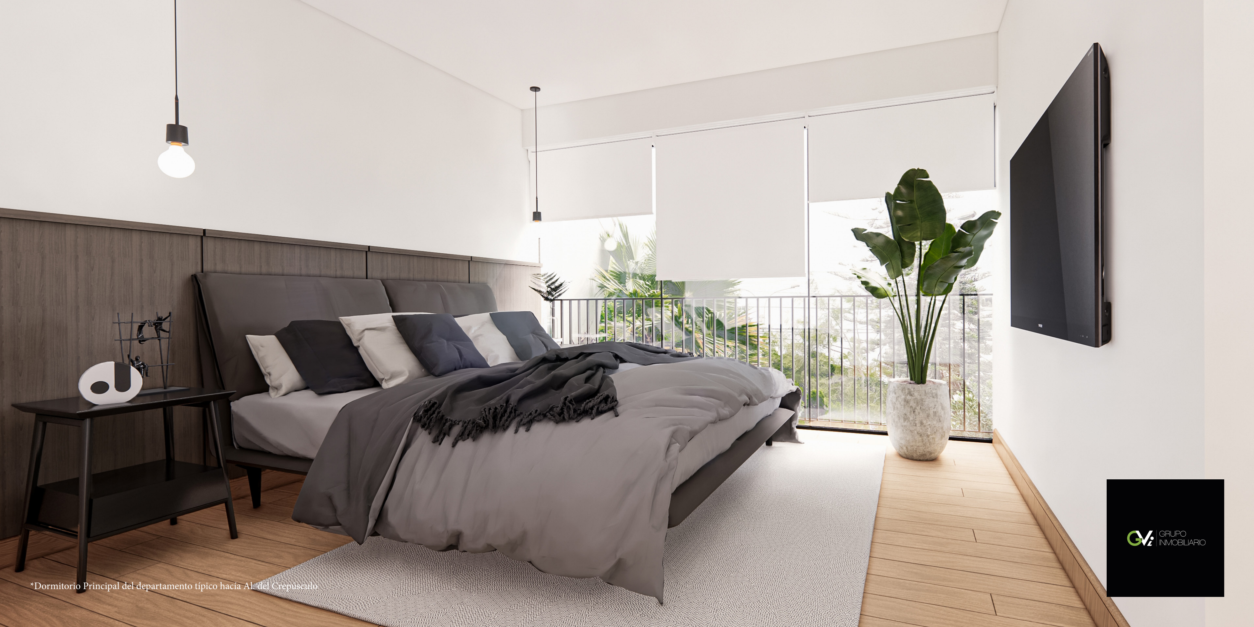
*Dormitorio Principal del departamento típico hacia Al. del Crepúsculo