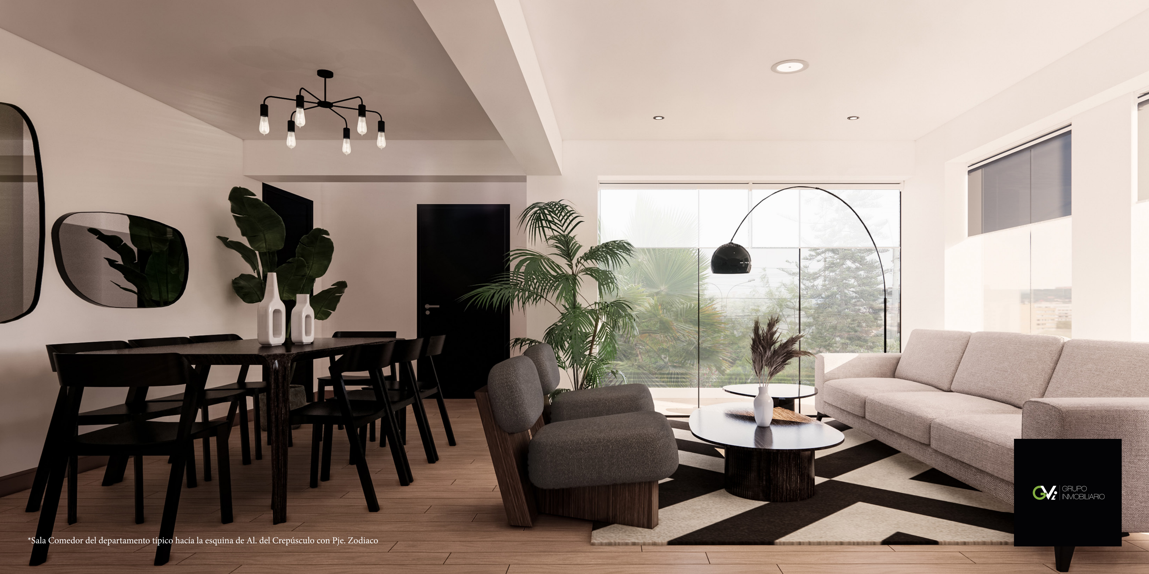
*Sala Comedor del departamento típico hacia la esquina de Al. del Crepúsculo con Pje. Zodiaco