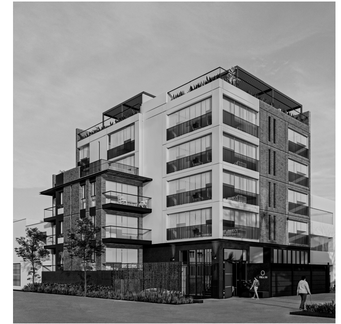
Alameda del Crepúsculo 305

Somos un equipo multidisciplinario liderado por 2 hermanos gemelos, iguales y distintos a la vez. La empresa tiene una filosofía de trabajo que alimenta la prioridad del equipo ante los intereses individuales. Es una búsqueda integral de un todo superior a través de la máxima contribución de cada una de las partes.